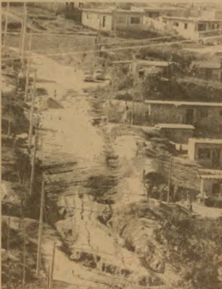
O duro é subir por esta rua. Os moradores que o digam