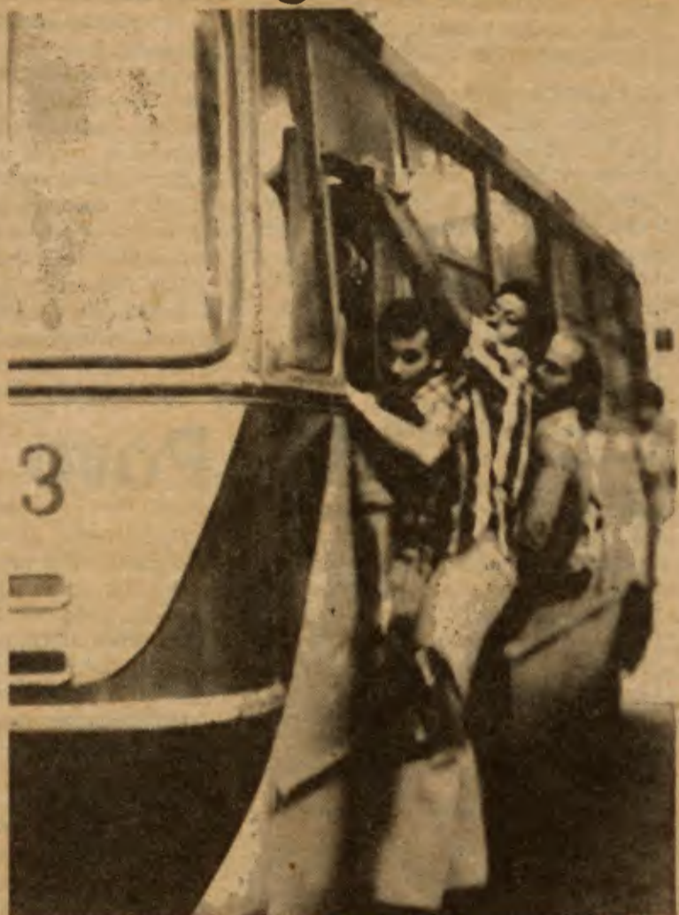
Ônibus abarrotados que nunca chegam, o pior problema da população guarulhense — Entra prefeito, sai prefeito, a situação não muda. Pág. 3.