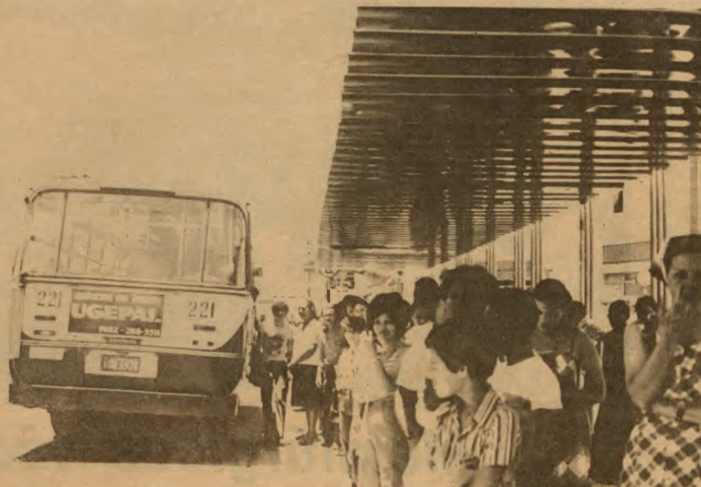
As filas intermináveis são uma constante nos pontos de ônibus de Guarulhos, a qualquer hora do dia