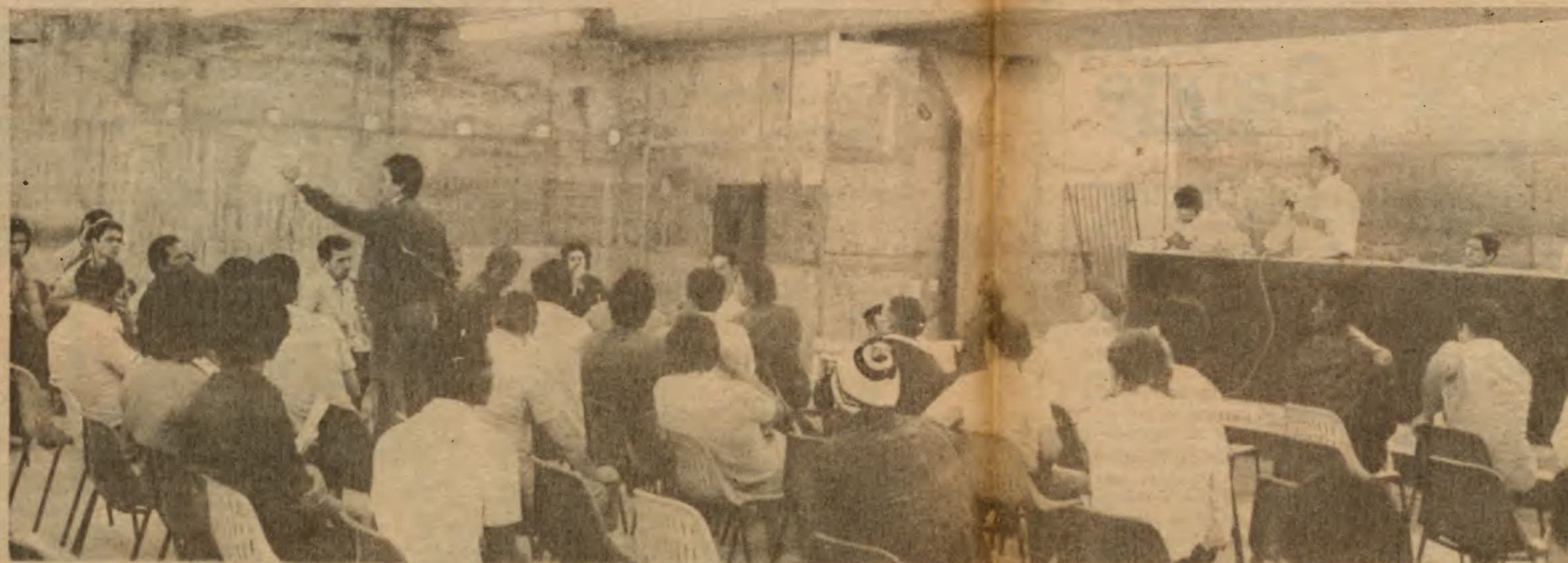
Foi uma assembleia com muita discussão onde os metalúrgicos decidiram convocar toda a categoria para a luta.

O poder de barganha do trabalhador para conseguir junto aos patrões o atendimento de suas reivindicações, será sempre determinado pela união de sua categoria e de sua determinação em lutar para conseguir seus objetivos.