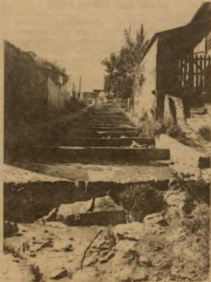
Além de pedestres outros elementos descem esta escada