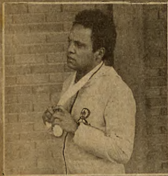
O Rei falou de tudo

Número 9 da Seleção fala exclusivo ao HP — Não quer aumento de ingressos e disse que pobreza não é eterna