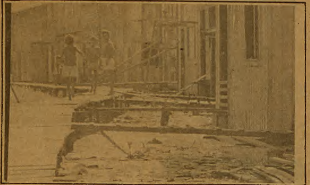
A miséria é uma paisagem constante no Jurunas

seguimos segurar as pessoas". Ela acha que é sério o problema do trabalho, que deixa pouco tempo, mas considera que "se a pessoa estiver conscientizada, ela faz um esforço, como já aconteceu no auge da campanha pelo Direito de Morar".