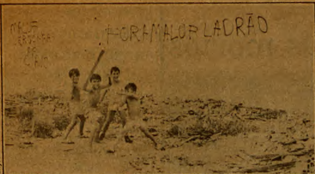
As pichações contra Maluf

Essa não foi a única manifestação assistida pelo general Figueiredo em São Luís. Também os moradores do bairro do Sá Viana levantaram cartazes protestando contra o Governo do Estado e a Reitoria da Universidade Federal do Maranhão, que tentam expulsá-los da área. (Walter Rodrigues, de S. Luís)