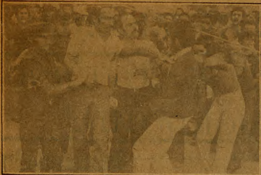
A polícia prendendo e arrebatando o povo, na visita do general Figueiredo a Belém