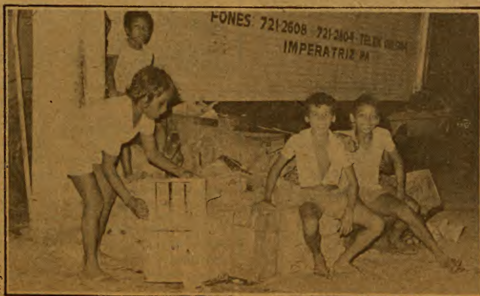
Essas crianças catam lixo para ajudar a família a comer