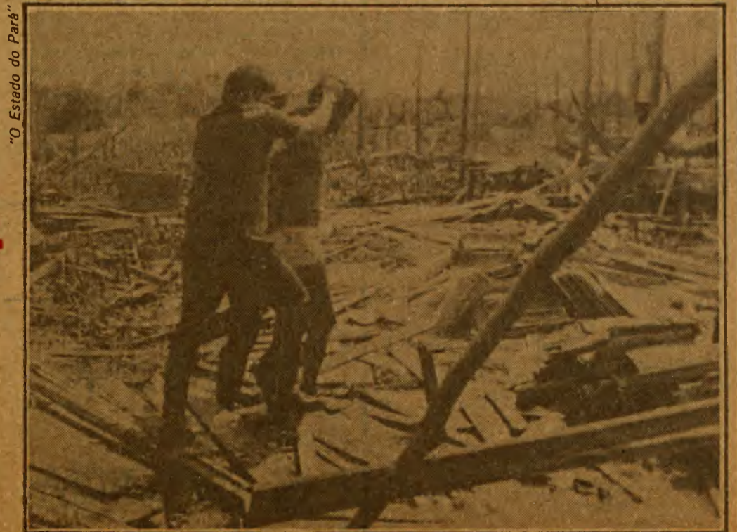
“O Estado do Pará”