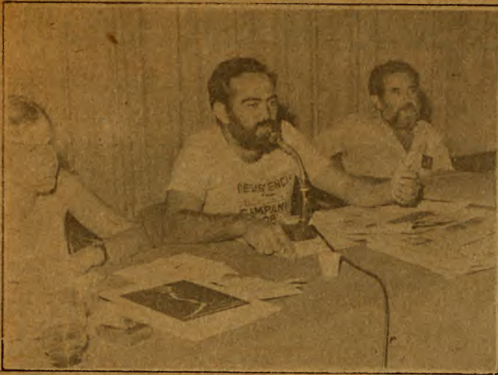
O presidente da SDDH no Congresso dos Sociólogos