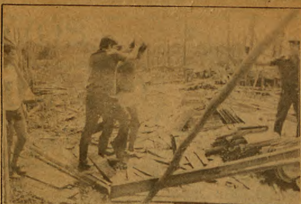
Selvageria: tenente da PM espanca morador da passagem Santana